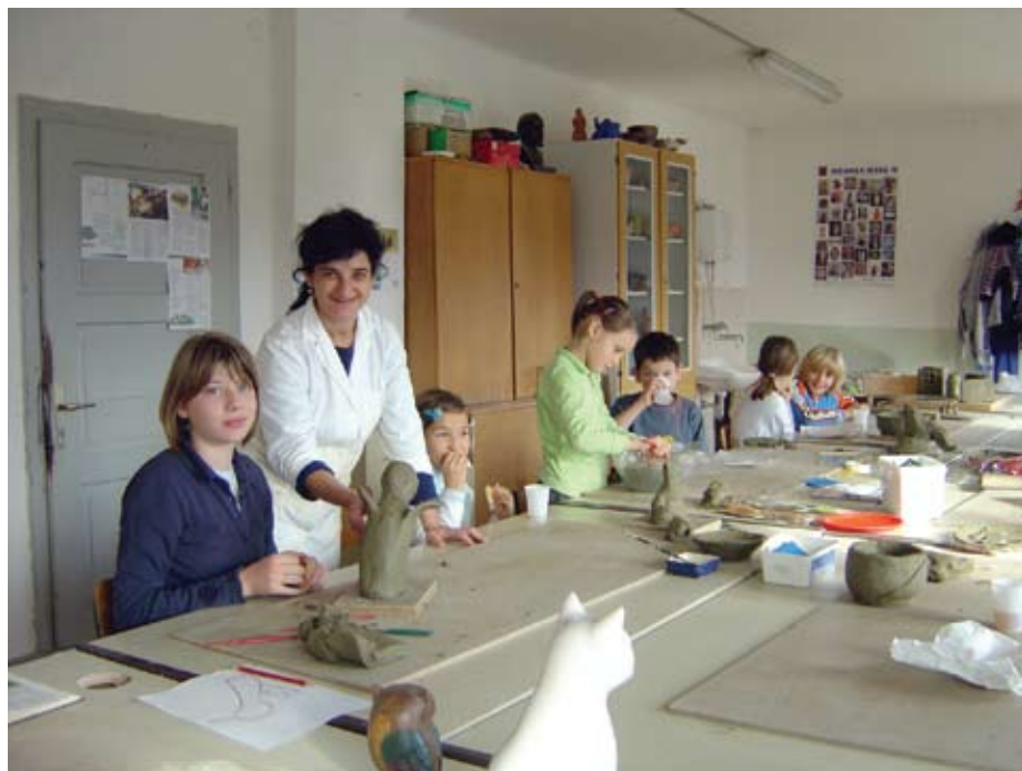
Oktobra 2010 je v Ambrusu potekal prvi otroški ex-tempore keramike.