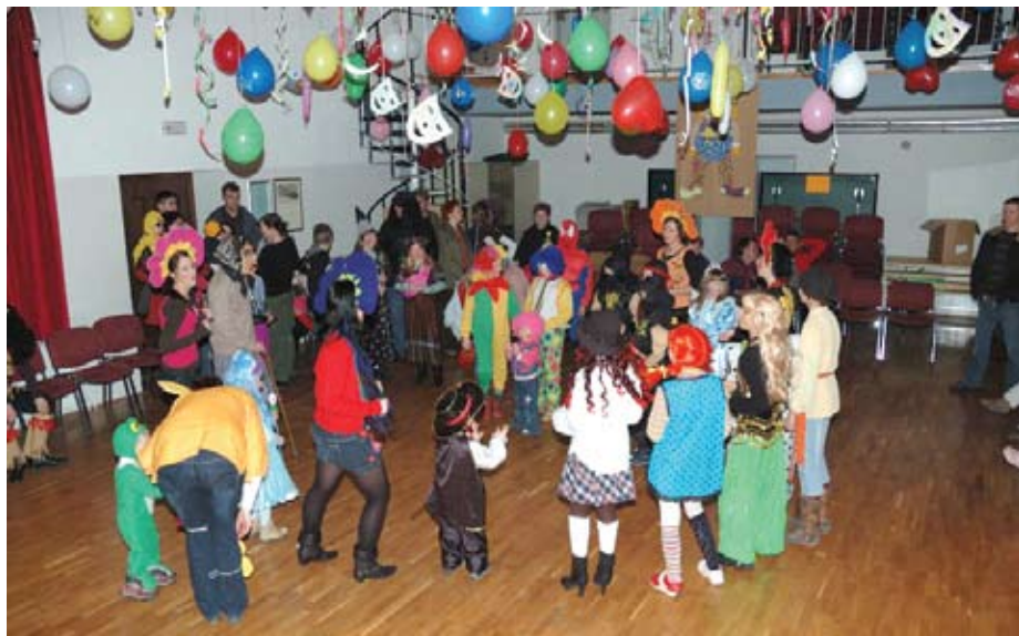
Eden od tradicionalnih dogodkov, ki jih organizira društvo, je pustovanje za otroke.)