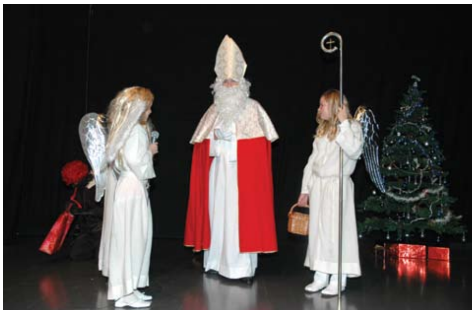
Otroke vsako leto obiše tudi sv. Miklavž.