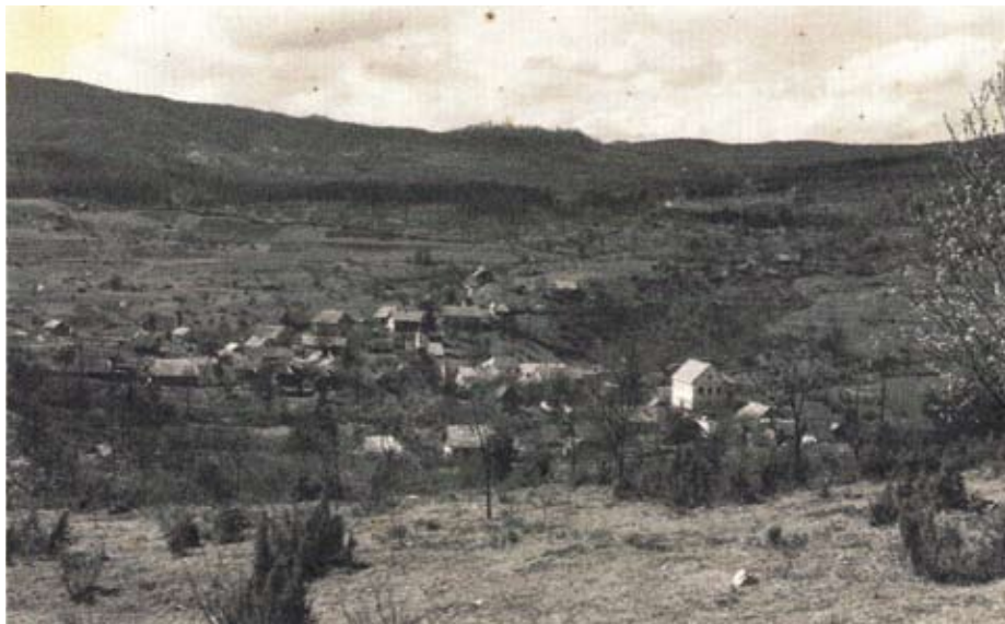
Fotografija Ambrusa, ki je bila posneta pred letom 1948.

Čeprav mineva 20 let, odkar se je osnovalo sedanje ogrodje društva, segajo njegove korenine še veliko dlje. Že v 50. letih je bilo v Ambrusu na področju kulture živahno. A tega, čemur smo priča danes, ne bi bilo, če ne bi bil leta 1948 zgrajen združni dom. »V Ambrusu so zgradili združni dom v 42 dneh,« so poročali v Slovenskem poročevalcu. »Ljudstvo od blizu in daleč ter zastopniki okraja so se zbrali, da skupno s prebivalci Ambrusa proslave delovno zmago.« Takrat enonadstropno zgradbo iz kamna je pomagalo zidati vse od blizu in daleč. »Nikdar ne bi stal v Ambrusu tak dom, če ne bi bilo sloge pri delu,« še piše Slovenski poročevalec. Za združni dom so porabili 26.000 delovnih ur, od katerih jih je 6.000 prispevala vas sama.