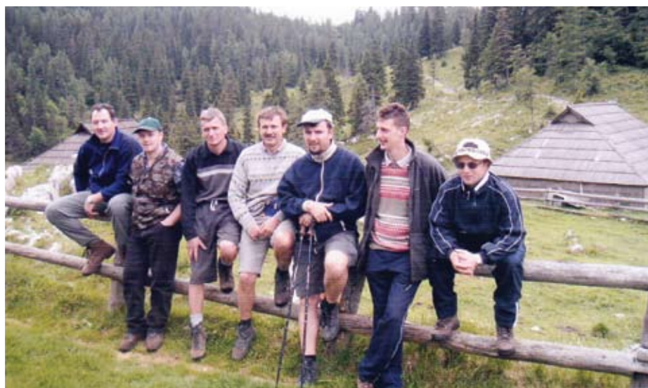
Pevci se vsako leto julija odpravijo na Veliko planino, kjer pripravijo koncert in uživajo v skupni družbi.