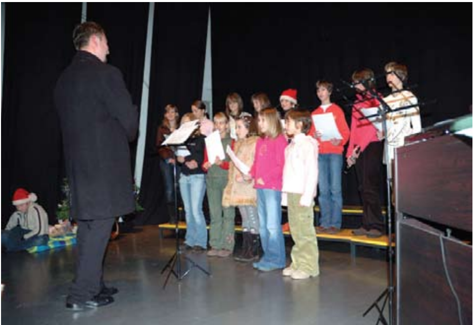
Otroški pevski zbor je sodeloval tudi na božičnem koncertu leta 2007.