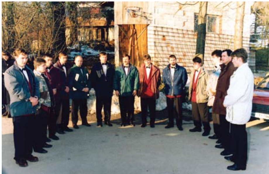
Moški pevski zbor v svoji najštevilčnejši zasedbi.