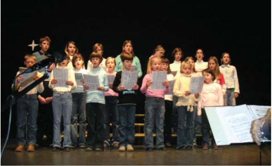
Otroški pevski zbor se je predstavil na koncertu leta 2005.