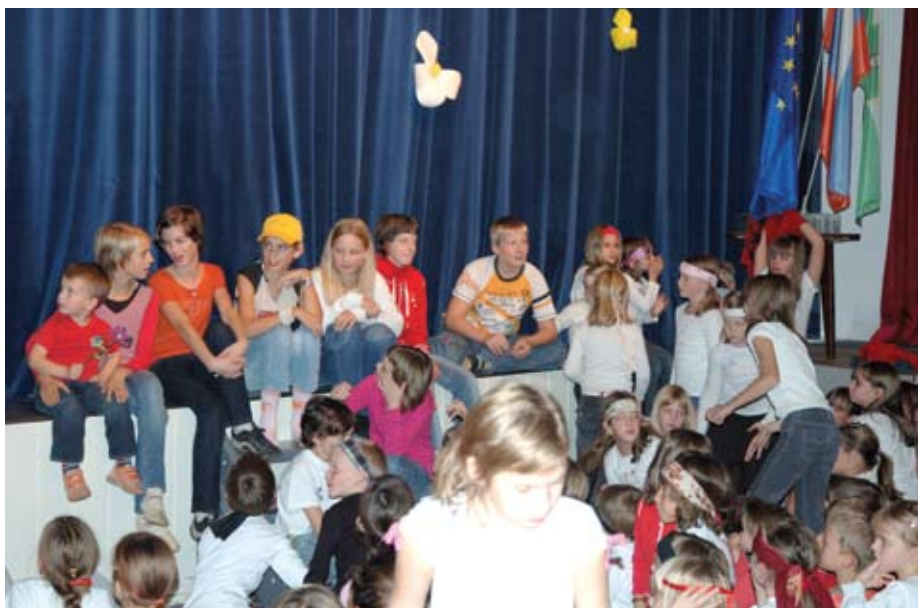
Plesalci se znajo tudi poveseliti. Takole so po enem od praznovanj rojstnega dne Guape čakali na torto.