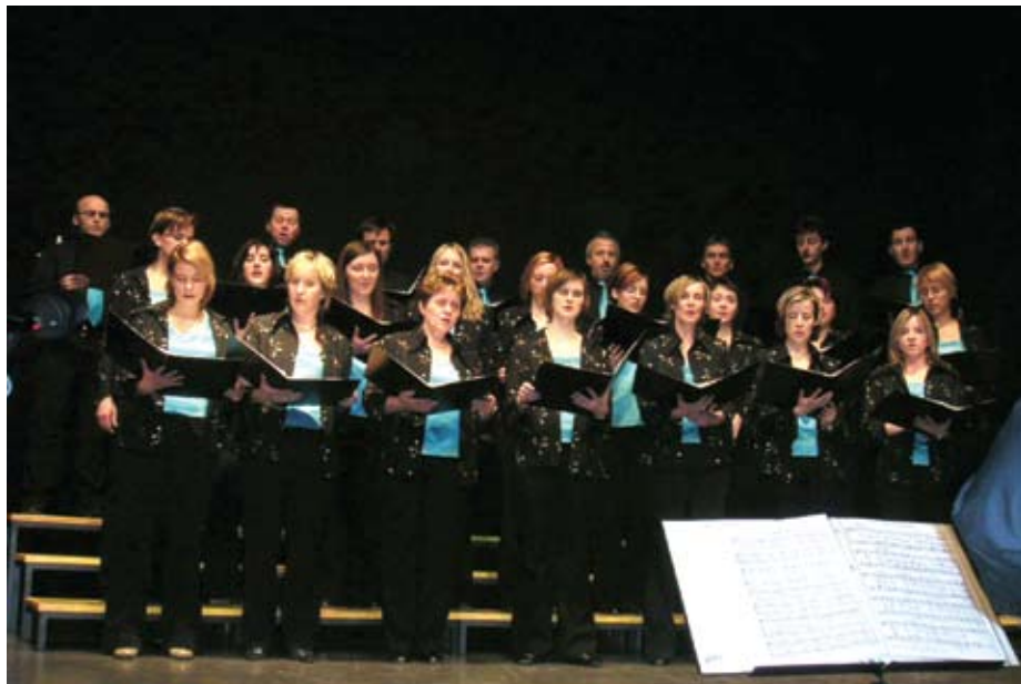
Mešani pevski zbor na letnem koncertu 2005.