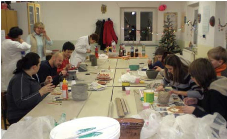
Večernih skupin se od lanskega leta udeležujejo tako odrasli kot otroci.)