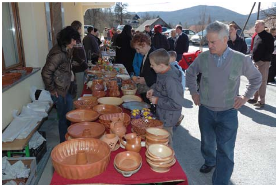
Dobro obiskan je bil tudi Velikonočni bazar leta 2010.