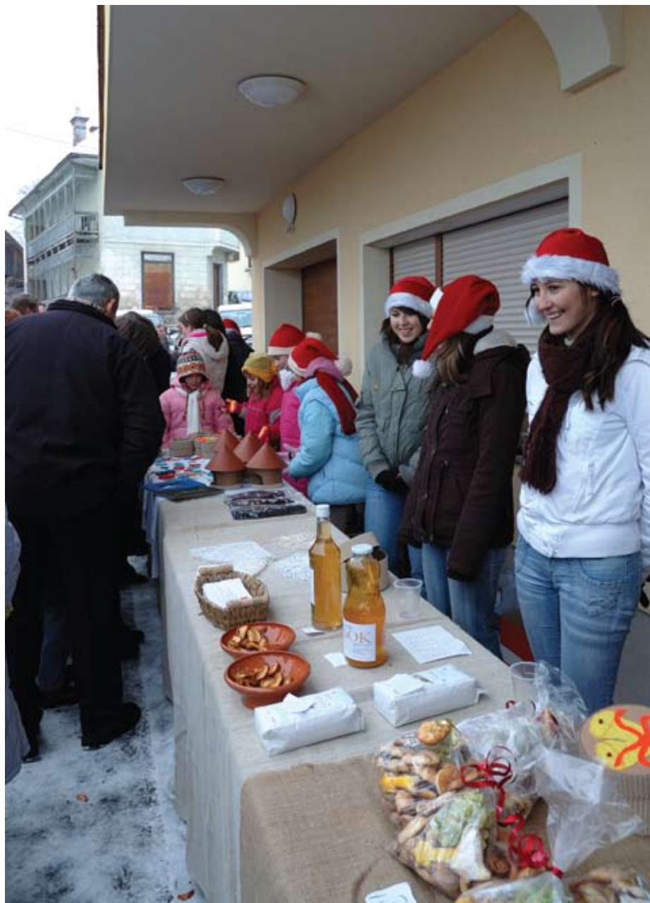
Prvi Božični bazar je potekal na božični dan leta 2007.