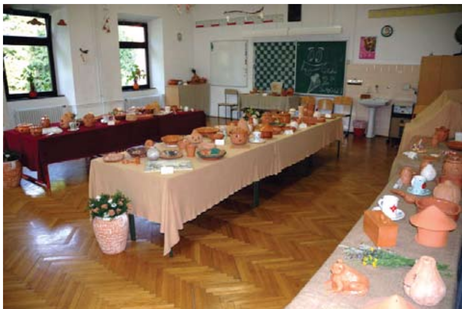
Na razstavi ob praznovanju krajevnega praznika člani ustvarjalne delavnice vsako leto predstavijo svoje izdelke. (razstava, junij 2008)