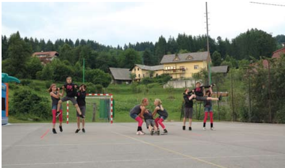
Točko Na ul'ci so odplesali tudi pred domačim občinstvom.