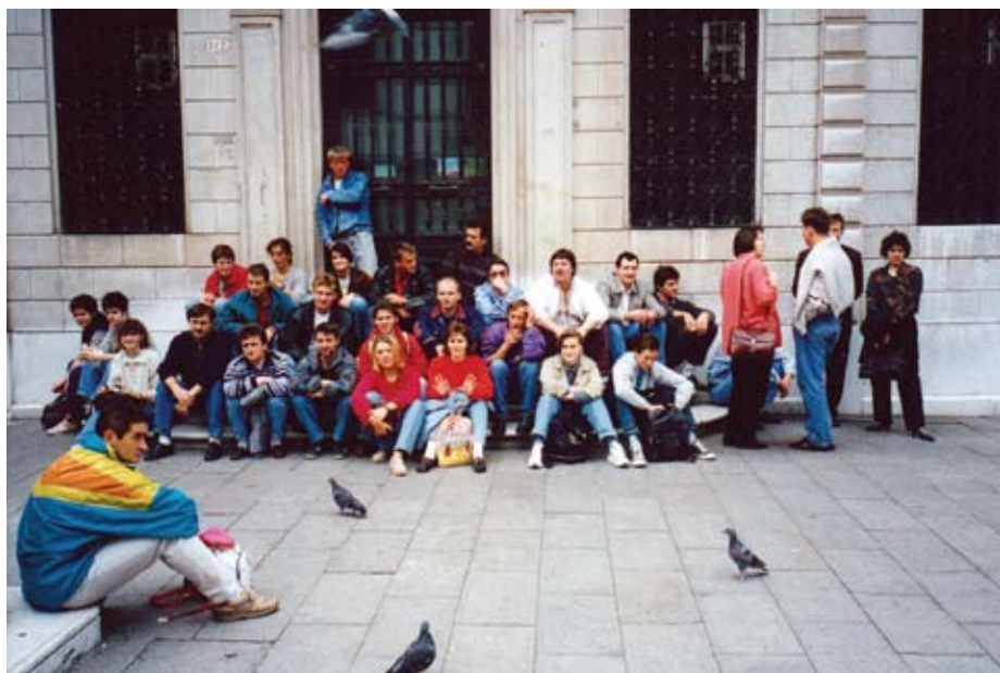
Člani kulturnega društva na izletu v Benetkah.

To so prav gotovo bili prvi večji organizirani koncerti moškega pevskega zbora, uprizoritve iger na igrišču in pridobitev lastnih prostorov za delovanje. Vsi ti uspešno izpeljani projekti so bili temelj za današnjo podobo društva in njegovo prepoznavnost.