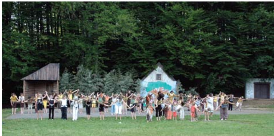
V predstavi Levji kralj je sodelovalo sto plesalcev.