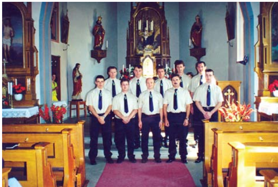
Moški pevski zbor na gostovanju v Hirschaidu.